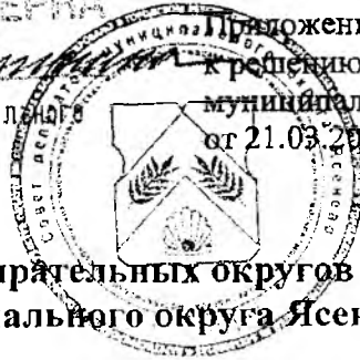
Схема многомандатных избирательных округов по выборам депутатов Совета депутатов муниципального округа Ясенево в городе Москве